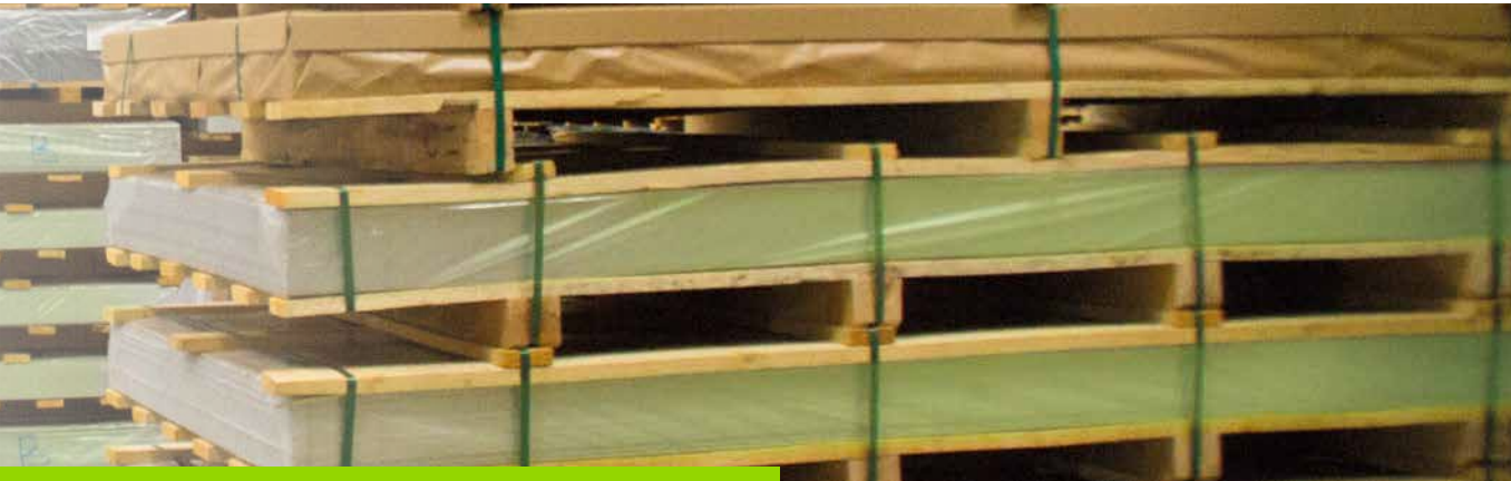
Ausführungsart und Oberflächenbeschaffenheit für Bleche nach EN 10 088-2